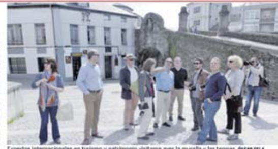
Expertos internacionales en turismo y patrimonio visitaron ayer la muralla y las termas. OSCAR CELA

Y también ayer, una delegación de expertos internacionales en conservación sostenible del patrimonio visitaron Lugo, dentro de un recorrido que están haciendo esta semana por toda Galicia. Lo hacen de la mano de la asociación Tesouros de Galicia , con motivo de la celebración mañana jueves 18 de abril del Día Internacional de los Monumentos. En Lugo visitaron la muralla y las termas romanas y también el castillo de San Paio de Narla y el balneario de Guitiriz .