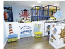
Abre el centro de ocio infantil Splash

El centro de ocio infantil con cafetería Splash Coffee Park abrió sus puertas en la calle Quiroga. Este nuevo local ofrecerá servicios de ludoteca y también organizará talleres para niños de 2 a 12 años. 1. ABOUZO