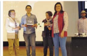
Los escolares de secundaria de Vila de Cruces recogieron el premio por su clipmetraje titulado «Saying no to poverty».

1 A Vila de Cruces, Serra de Outeiro, Cambre y Cangas do Morrazo fueron a parar los premios de la fase gallega del Concurso de Clipmetrajes elaborados por alumnos de secundaria, un certamen organizado por Manos Unidas. El mejor clipmetraje fue, para el jurado, Saying no to poverty , del IES Marco do Camballón de Vila de Cruces.