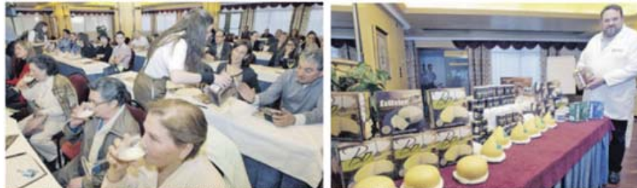
La empresa Leiteiro presento ayer con una degustación de leche y derivados en el Gran Hotel los productos que va a vender a domicilio en Lugo y otros lugares.