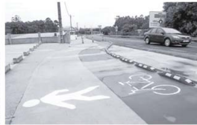
El aspecto será similar al ya ejecutado en el puente de A Illa y su salida vilanovesa

El presupuesto de las actuaciones rondará los 600.000 euros. La primera fase, la que se prevé ejecutar en 2013, costará unos 400.000 euros y se corresponderá al tramo más urbano. El que llevará la doble senda para peatones y bicicletas desde el entorno del Club de Jubilados y el parque infantil cercano hasta la plaza que lleva hacia las playas de O Terrón, conectando con la carretera general.