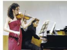
Concierto de violín y piano

El centro de ocio infantil con cafetería Splash Coffee Park abrió sus puertas en la calle Quiroga. Este nuevo local ofrecerá servicios de ludoteca y también organizará talleres para niños de 2 a 12 años. 1. ABOUZO