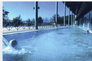
Bañeiro de Laia, no concello lugrés de Cenlle, instalacións que visitarán s especialistas británicos