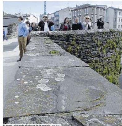
El grupo, visitando el adarve de la muralla. MARTA BECERRA